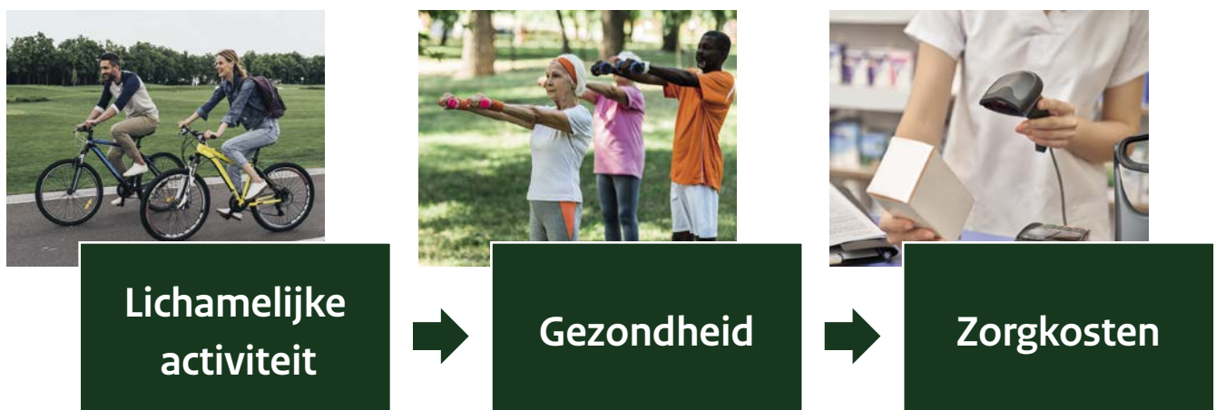
Figuur 2. Schematische weergave van de vraagstelling in het literatuuronderzoek.

is berekend. Deze publicatie beschrijft de maatschappelijke kosten en opbrengsten van lichamelijke activiteit 7 . Geschat wordt dat in Nederland elke Euro besteed aan lichamelijke activiteit een nut oplevert dat 2,51 Euro waard is 7 . Hierin zijn onder anderen kosten van voorzieningen en sportbenodigdheden opgenomen en opbrengsten door kwaliteit van leven, ziekteverzuim en arbeidsproductiviteit.